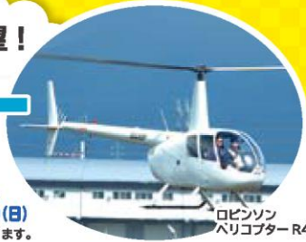
ロビンソン ヘリコプター R44

実施 予定日 7/18(土)・19(日)・20(月)・25(土)・26(日)・ 8/1(土)・2(日)・8(土)・9(日)・13(木)・14(金)・15(土)・16(日)